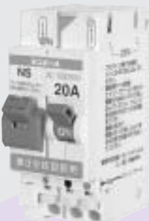
単相3線分岐配線用 ニュートラルスイッチ(NS)付 パールミニブレーカ (分電盤組込専用)