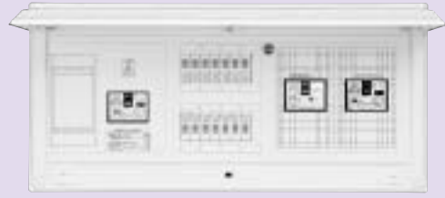
燃料電池側遮断器 B-33EC(30AF/20AT)