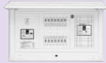
燃料電池側遮断器 B-33EC(30AF/20AT)