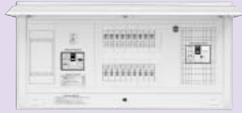
ガス発電側遮断器 B-33EC(30AF/20AT)