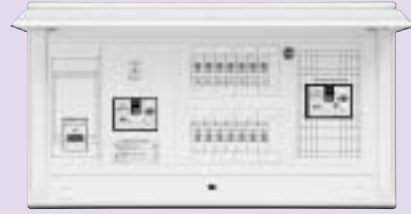
太陽光側遮断器 単3連系の場合 B-53EC(50AF/30AT) 単2連系の場合 BU-53・1ECS(50AF/30AT)