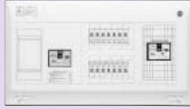
太陽光側遮断器 単3連系の場合 B-53EC(50AF/30AT) 単2連系の場合 BU-53・1ECS(50AF/30AT)