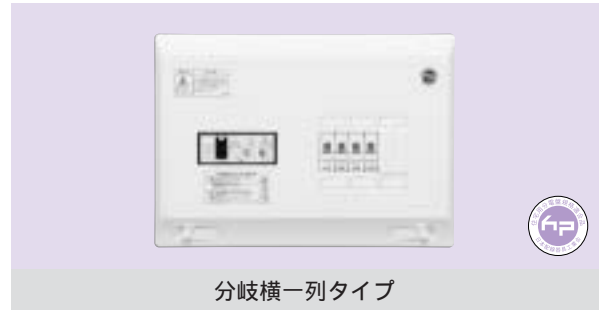
分岐横一列タイプ