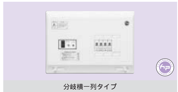
分岐横一列タイプ