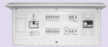
リミッタースペース付