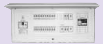
リミッタースペースなし