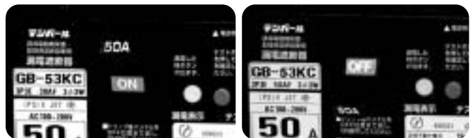
ON/OFFは見やすいカラー表示!!