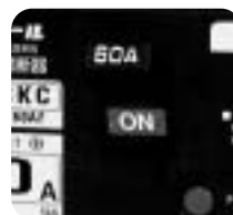
ON/OFFは見やすいカラー表示!!