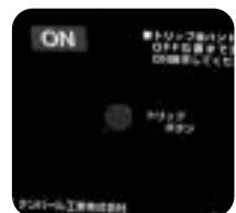
トリップボタンを装備!!