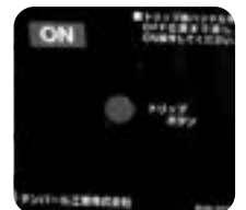
トリップボタンを装備!!