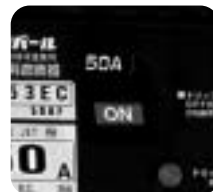
ON/OFFは見やすいカラー表示!!