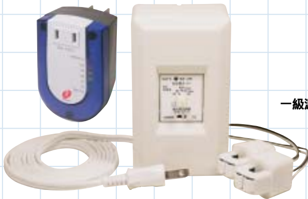
電流表示装置 セーブくん