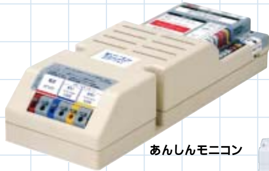
あんしんモニコン