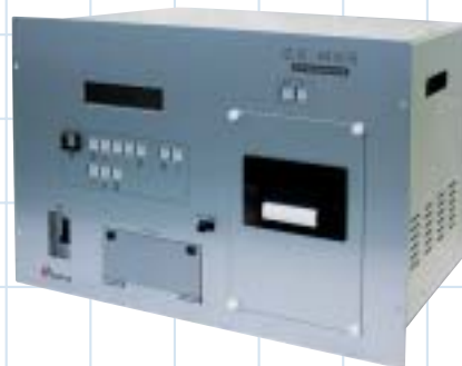
直流電路地絡検出装置 DS-MNB