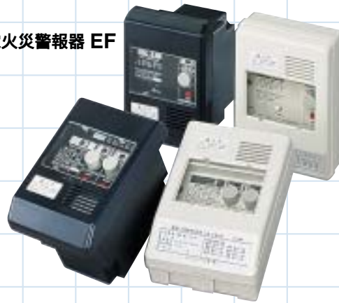
一級漏電火災警報器 EF