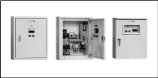
給水又は排水の自動運転