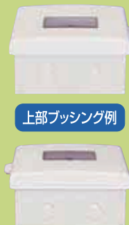
上部ブッシング例