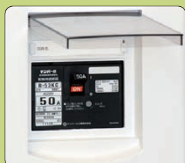
ブレーカ操作小窓(屋内用)