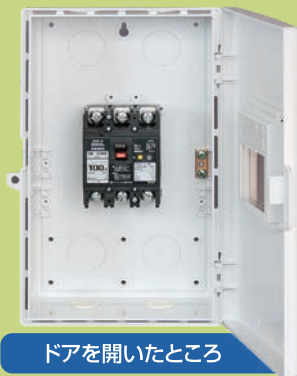
ドアを開いたところ