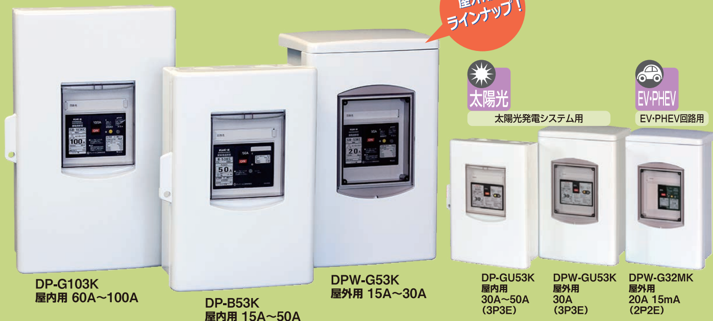
DP-G103K 屋内用 60A~100A