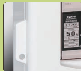
ドア部南京錠取付穴